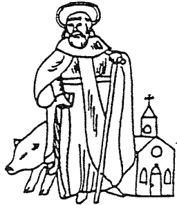
GILDE ST. ANTONIUS ABT LIEROP

16 30 uur 4 18 uur. Tentoonstelling van vaandels, koningsreizen, gilde- attributen en documentatie in de kleine tent op sportpark "de Kerkant". Op deze tentoon- stelling is iedereen van harte welkom. Althans als verbijding in de feesttent door de "Kopel- blazers". Wij verzoeken de inwoners van Lierop om op zondag de slag niet te slaan. Wij vragen u vriendelijk de route van de op- tocht zoveel mogelijk onverij te houden. Wij hopen dat dit gildefeest met medewer- king van u allen nog slagen.