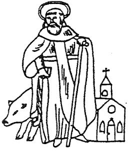
GILDE ST. ANTONIUS ABT LIEROP

uniformen van de financiering 2 van drie nieuwe uniformen heeft een speciaal bureau opgericht emite "het uniform fonds" door allerlei actie een bedrag van ca. 14200,- bijeen gebracht. De bekende actie is wel de oud-gaan actie. Deze uniformen