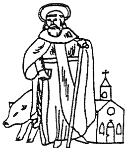
GILDE ST. ANTONIUS ABT LIEROP