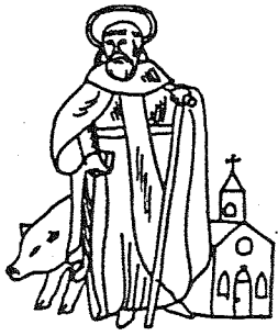
GILDE ST. ANTONIUS ABT LIEROP