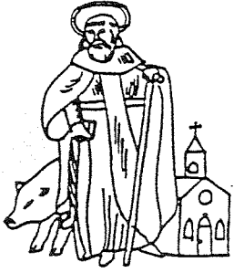
GILDE ST. ANTONIUS ABT LIEROP