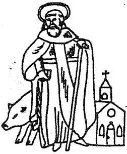
GILDE ST. ANTONIUS ABT LIEROP

19 00 uur, kennis gegeven met vanwege H. Willebrorden en gilde D.L.C. van de Boven Weer. Dinsdag 10 september 9 00 uur, Eucharistieviering opgedragen aan de overleden leden van de beide gilden.