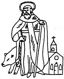
GILDE ST. ANTONIUS ABT LIEROP

gebracht en zullen de vrouwen 2 (gildeleden) wel regelmatig mee. Dit alles naar aanleiding van een gildecongres te Ghoblen in België. Dit vierde congres, van (16 maart 1905) schuifergilden van het oude herzogdom Brabant, waarvoor ook een aantal werheidsleden