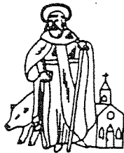
GILDE ST. ANTONIUS ABT LIEROP