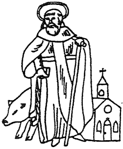
GILDE ST. ANTONIUS ABT LIEROP