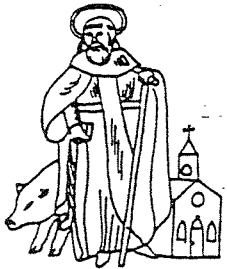
GILDE ST. ANTONIUS ABT LIEROP