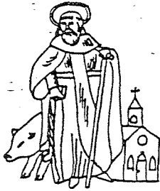
GILDE ST. ANTONIUS ABT LIEROP

2 bij de overheid. Ook zal tijdens deze vergadering van Abt worden gehandeld die de van nu af 25-jarig lidmaatschap van het de van de overheid aan geboden kan er worden wordt deze vergadering afgebroken. Als derde onderdeel van deze vergadering de Leeraard. Deze begint om 20 00 uur met de traditionele koffie Tafel inaal van Rooskenshout, alwaar de avond om 21 30 uur wordt voortgezet onder de muzikale tonen van het duo Paloma uit Dourne.