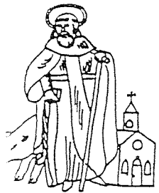
GILDE ANTONIUS ABT LIEROP

Programma Maart: 6 Maart: Algemene vergadering te Brussel 9 Maart: Groot-Semeren overleg te Semeren- Lind. 27 Maart: Ond. yveractie