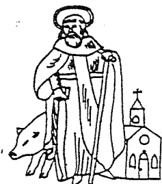
GILDE ST. ANTONIUS ABT LIEROP

Inleiding: Het gilde heeft een reeds sinds jaar en dag. Om alle acti- viteiten te vermelden zou veel meer aan ruimte van de kapel vragen, daarom een verkorte samenvatting van de meest aansprekende gebeurte- nissen.