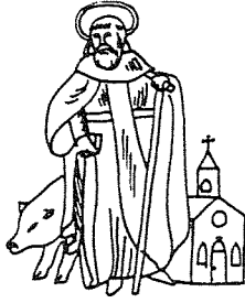
GILDE ST. ANTONIUS ABT LIEROP