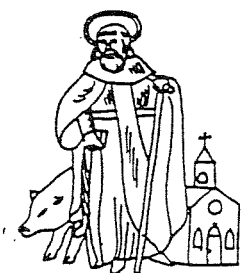
GILDE ST. ANTONIUS APT LIEROP

2 Tafel. Thema werd de avond voort- gezet onder de blanke klanke van muziek met een dans en een draagje Mariakapel. In samenwerking met het o.l.v. gilde werd begin mei be- gonnen met de renovatie van de Maria- kapel. Op zondag 6 september werd deze met daarin een nieuw Maria beeld door pastoor Kemmer ingezegend. Hierbij waren naast de volksallege gilden ook de Eunice. Ond. Indigingen aanwezig.