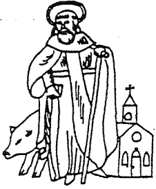
GILDE ST. ANTONIUS ABT LIEROP

huy: gilde St. Antonius Abt Lierop heeft op zaterdag 8 mei weer een jaarlijkse Geranium verkopen gilde- breedte en gilde om te laten vanaf half elf 's morgens geranium te koop aanblij- ven in de kerk van Lierop.