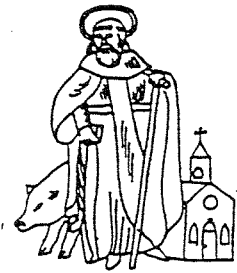
GILDE ST. ANTONIUS ABT LIEROP