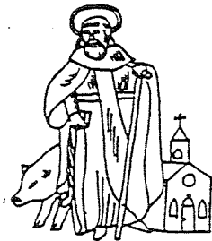
GILDE ST. ANTONIUS ABT LIEROP

vergadering, 1 december, werd het voorstel van de overheid om na 45 jaar van gildelin te pranderen, unaniem goedgekeurd. Het voorstel om te verhuizen werd gedaan na een goed overleg met de eigenaar en met de beherder van café de Babbelaar. Het nieuw gildelin is nu café 't Jagerbinn.