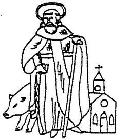
GILDE ST. ANTONIUS ABT LIEROP