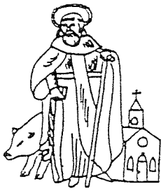
GILDE ST. ANTONIUS ABT LIEROP

Oud-jaaractie : die wordt gehouden op vrijdag 27 maart. Wij vragen u vriendelijk om tijdig het oud-jaar en anderen metalen zoals lood, zink, aluminium, koper enz. voor het huis klaar te zetten. Vanaf half tien gaan de gildeleden op pad om de oude metalen te verzamelen. Bij de grote partijen hebben liggen of buiten zware stukken, daarvoor komen de opkalers graag achterom, u dient ze dan even te waarschuwen of te bellen tel. 1630. In het dorp zelf wordt niet uitge- held. Dit zal wel worden gedaan in het buiten gebied.