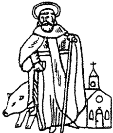
GILDE ST. ANTONIUS APT LIEROP

koning aan “den volke getoond” waarna hem en zijn familie een receptie werd aangeboden in gildenhuis café ‘t Jagershuis. Deze, druk bezochte receptie, werd met een vendelhulde van gilde Onze Lieve Vrouw van de Zeven Weeën afgesloten. Waarna het koningsfeest werd hierna gezamenlijk voortgezet tot ongeveer 18.00 uur. Rond die tijd werd de koning met zijn gevolg door de beide gilden naar het huis van zijn broer begeleid waar met een vendelhulde van zijn eigen gilde deze prachtige dag vol met tradities werd afgesloten.