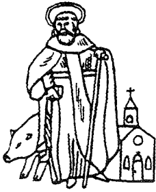
GILDE ST. ANTONIUS ABT LIEROP