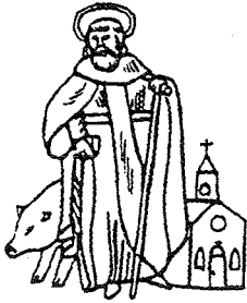
GILDE ST. ANTONIUS ABT LIEROP

Voorjaarsledenvergadering: Deze vergadering gehouden op 31 maart in gildenhuis café 't Jagershuis. Op de agenda onder meer koninginnedag (30 april), schieten 't Zorgenkind (03 mei), processie Beauraing (03 mei), processie Ommel (21 mei), geraniumactie (09 mei) en de gildenfeesten Mierlo (07 juni) en Aarle-Rixtel (28 juni).