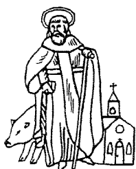
GILDE VAN SINT ANTONIUS ABT LIEROP