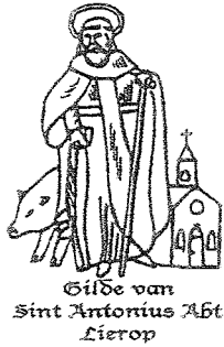
Gilde van Sint Antonius Abt Lierop