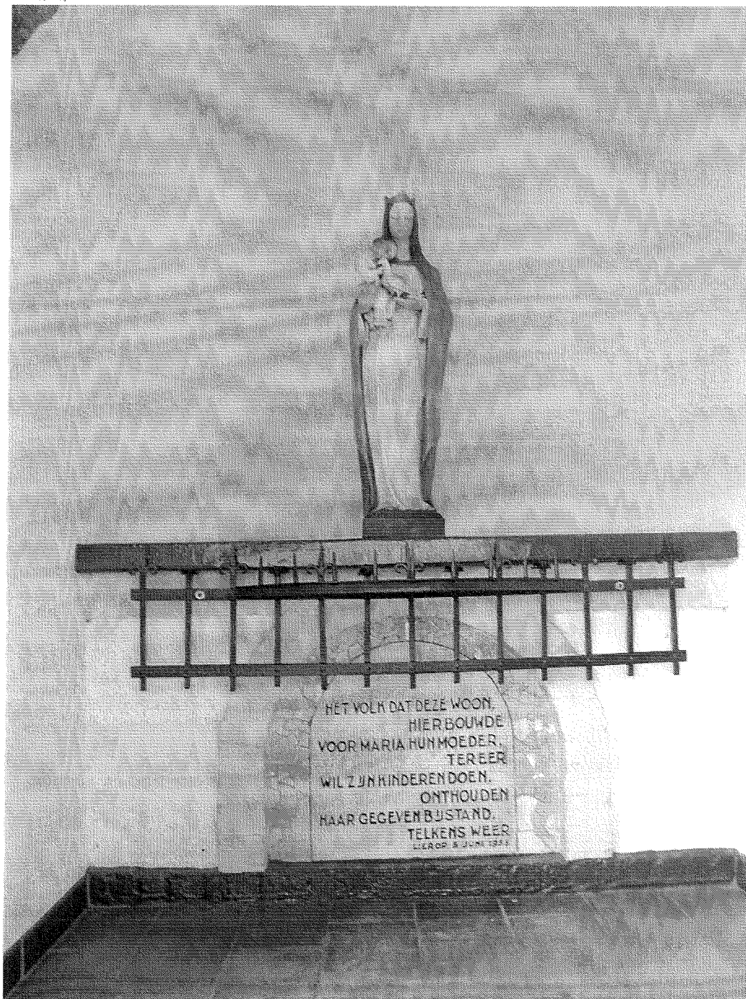
Foto nieuw Mariabeeld in de p3260095.jpg kapel van Hersel..

Bijgeleverde foto kapel